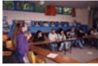
6 e Assemblée Générale du mouvement 4x8 le 13 juin 1998