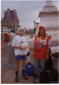
VILVORDE, JOSPIN ET CHOMEURS. 87 e Rassemblement contre le Chômage et l'Exclusion le 6 juin 1998.