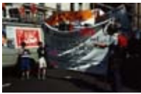
Défilé 1er Mai 1990, Paris