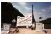
Manifestation TOES 15 juillet 1989 (bi-centenaire 1789)