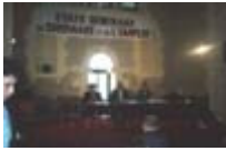
Les Etats Généraux du Chômage et de l'Emploi, 24 à 27 sept 1992 à Thiviers(24)