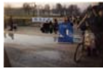
Enterrement des promesses électorales de Jacques Chirac le 7 décembre 1996