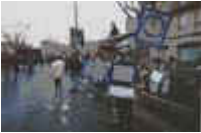
Manifestation contre le Chômage et l'Exclusion janvier 1998