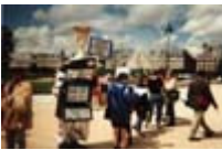
Rassemblement contre le Chômage et l'Exclusion au jardin des Tuileries août 1997