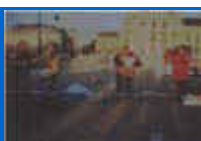
Le Président et son Premier ministre sont accusés de non-assistance à chômeur en danger (2). 75 e Rassemblement contre le Chômage et l'Exclusion 6 décembre 1997.