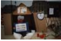
Rassemblement au jardin de Tuileries Noël 1996 (1)