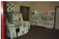
Etats Généraux du Chômage et L'Emploi, La Plaine St Denis, mars 1990