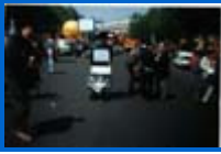
Défilé de la place de la République à la Nation le 1er mai 1998