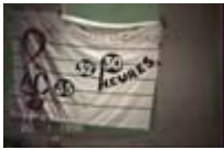
Assises d'AC 20 Paris 8, ST Denis 1996. Forum sur les 32 heures (2)