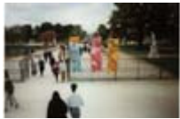
1936/1996 : 60e anniversaire des 40 heures et des congés payés au jardin de Tuileries juin 1996