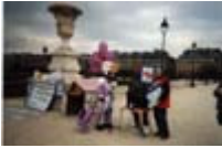
82 e Rassemblement contre le Chômage et l'Exclusion 21 mars 1998, au jardin des Tuileries (2)