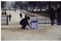
28 e Rassemblement contre le Chômage et l'Exclusion janvier 1996, au jardin des Tuileries