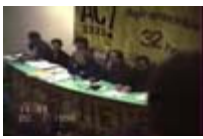
Assises d'AC 20 Paris 8, ST Denis 1996. Forum sur les 32 heures (1)