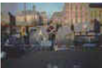
Le Président et son Premier ministre sont accusés de non-assistance à chômeur en danger (1). 75 e Rassemblement contre le Chômage et l'Exclusion 6 décembre 1997.