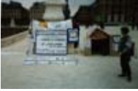
82 e Rassemblement contre le Chômage et l'Exclusion 21 mars 1998, au jardin des Tuileries (1)