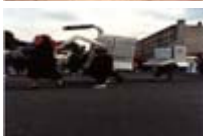
Défilé des associations d'Herblay juin 1989