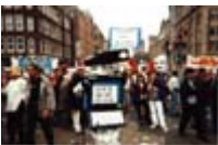
Manifestation contre le Chômage et l'Exclusion Amsterdam 14 juin 1997