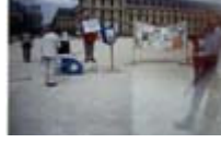
Bienvenue aux chômeurs, en route pour la grande manifestation à Amsterdam, au jardin des Tuileries (23/05/1998)