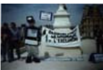
Robot au Rassemblement contre le Chômage et l'Exclusion au jardin des Tuileries sept 1997