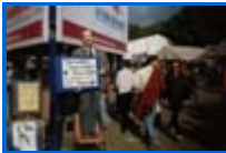
Fête de l'Humanité septembre 1996 : "Tout va bien, Tout va bien, Tout va ... !!